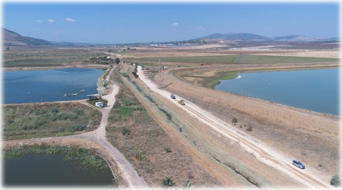
בתמונה: הסדרת דרך וניקוז לאורך תוואי נחל חרוד, מכביש 669 מערבה